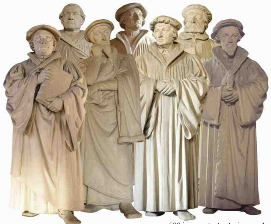
500 jaar protestant, zie pag. 4