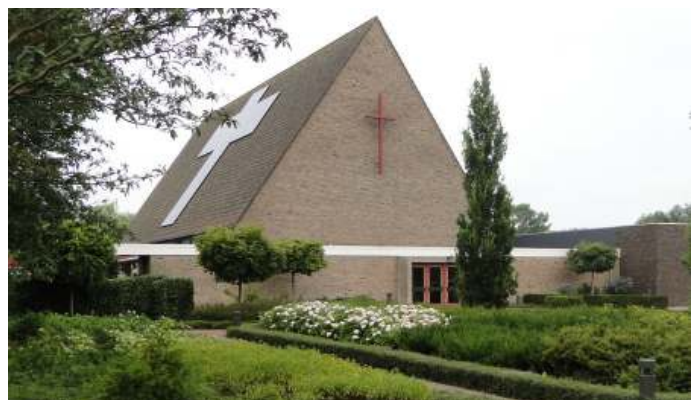
De groene kerk - met zonnepanelen! - in Broek op Langedijk