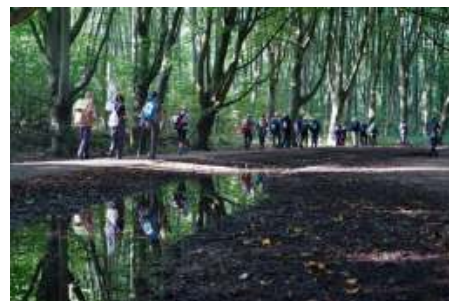
Foto-3 Klimaatmars - 10 oktober

(voor Limmen kunt u terecht bij CALorie: www.calorieenergie.nl )