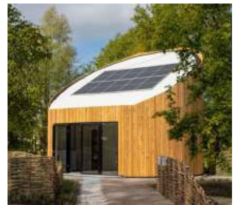
De groene 'Tiny Church' op de Floriade