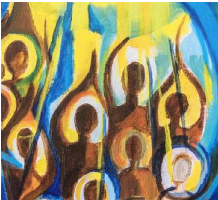
Heilig vuur (Handelingen 2:1-11)

De redactie wenst u mooie Pinsterdagen, met veel aandacht voor elkaar.